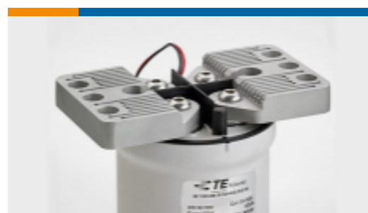
TE 产品编号1-1618413-7 K1K06X012EAFA=CONTACTOR, 12VDC COIL, K1K