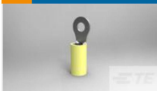
TE 产品编号 2-320568-2 TERM, RT, PIDG IR, 12, #8