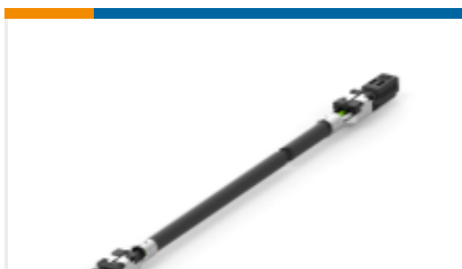
TE 产品编号2362764-3 MATENET,CABLE ASSY,1 GBPS UTP