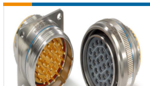
TE 产品编号ZPF00000000036945 983-6SE 14-04 SN-L