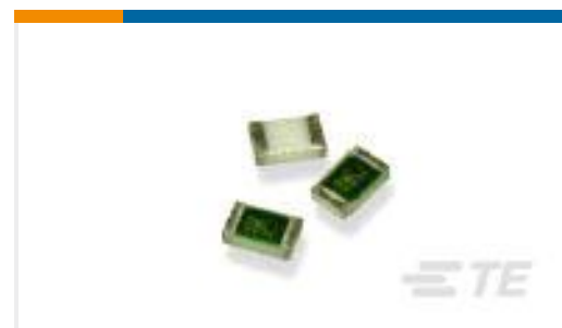
TE 产品编号1-1879336-4 CPF 0603 316R 1% 50PPM 1K RL