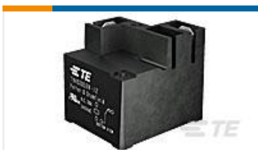
TE 产品编号3-1419104-8 T9AS5D22-48