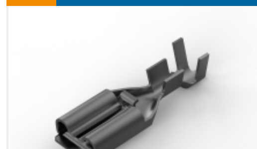
TE 产品编号 175022-1 250 PLEX REC. 18-14AWG PTBR