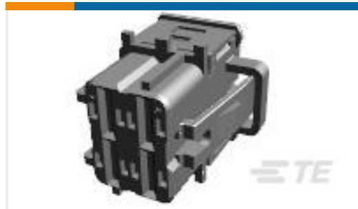
TE 产品编号1534404-2 MCP6.3 RECEP HSG4P