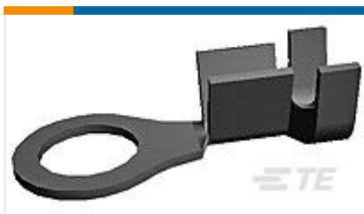
TE 产品编号160787-1 RING TONGUE IS 18-14 AWG .0840 X . 940 BR