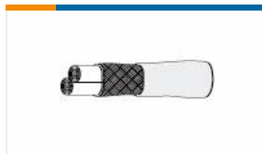
TE 产品编号333001-007 55A1811-22-9-9