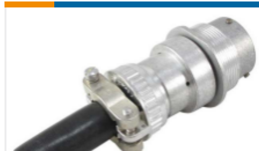
TE 产品编号HD34-18-14SE-059 REC,14P,AL,E, CBL CLMP BT, DRAIN, 16,S,MC