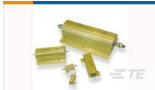
TE 产品编号2-1630024-5 HSC250 6R8 5%