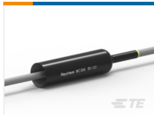
TE 产品编号CU6585-000 WCSM-110/30-1000/S(S5)