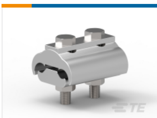
TE 产品编号705580-000 HEL-3591