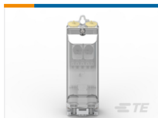
TE 产品编号543072-000 EKM-2050-2D1/FIX-5S