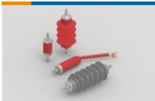
避雷器与电涌放电器(45)