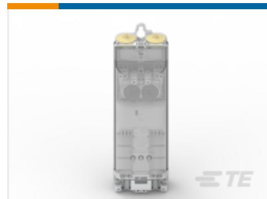
TE 产品编号CS0532-000 EKM-2050-2D1-5S/U-E3