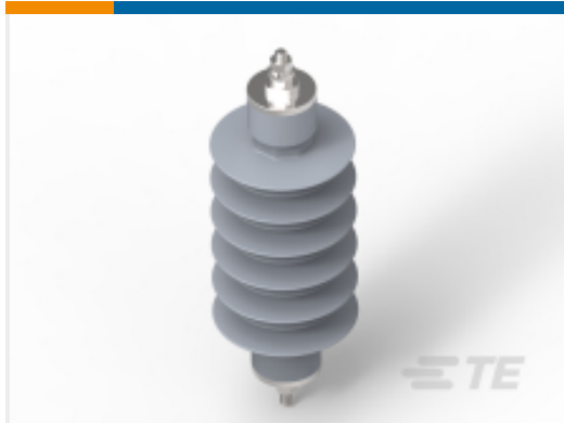
TE 产品编号 A38048-000 BOW-OCP2-30M-NFF