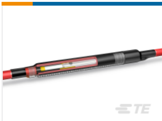
TE 产品编号CM0994-011 MXSU-5111-L