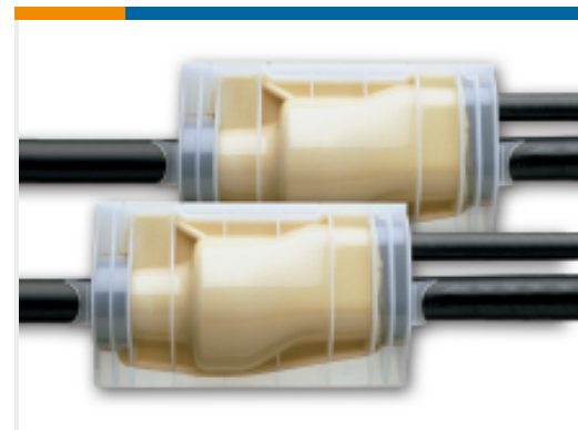
TE 产品编号EF6714-000 MM-5-43BC170