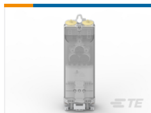
TE 产品编号669434-000 EKM-2050-3D1-5S/U-E3