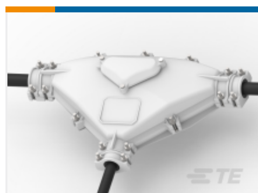
TE 产品编号407812-000 HMY-701-EM