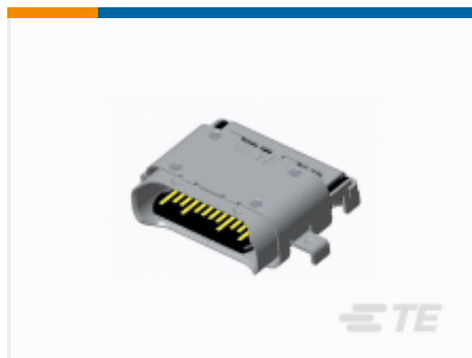
TE 产品编号1-2295018-2 USB TYPE C, REC OFFSET 0.65MM DUAL SMT