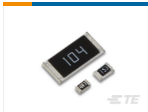
TE 产品编号2-2176346-0 CRGCQ 1210 1K5 5%