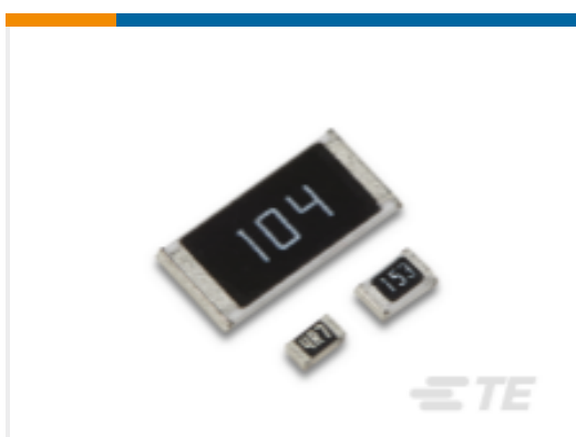
TE 产品编号2-2176346-1 CRGCQ 1210 2K2 5%