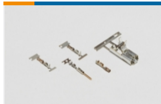
线到板连接器端子(66)