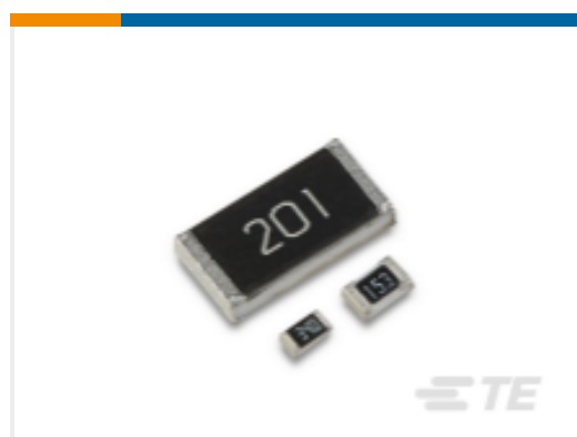
TE 产品编号2-2176329-5 CRGP 1210 1K0 1%