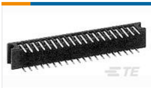
TE 产品编号 5-532956-7 40 MODII 2PC CE RCPT ASSY, RoHS