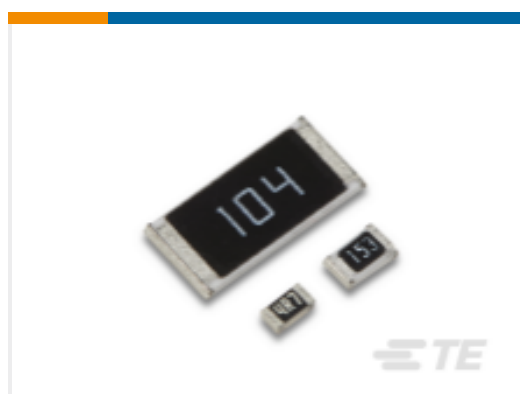
TE 产品编号1-2176346-6 CRGCQ 1210 330R 5%