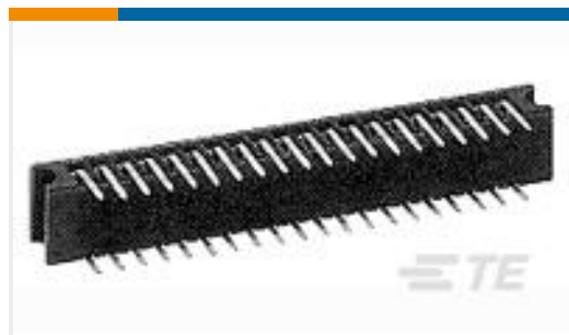
TE 产品编号 6-534204-2 MODU 2-PC CE RECP ASSY 40 POS, RoHS