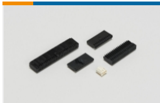
线到板连接器组件和护套(5)