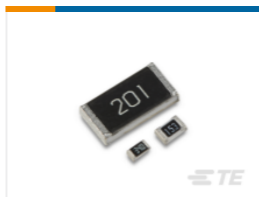
TE 产品编号2-2176329-3 CRGP 1210 680R 1%