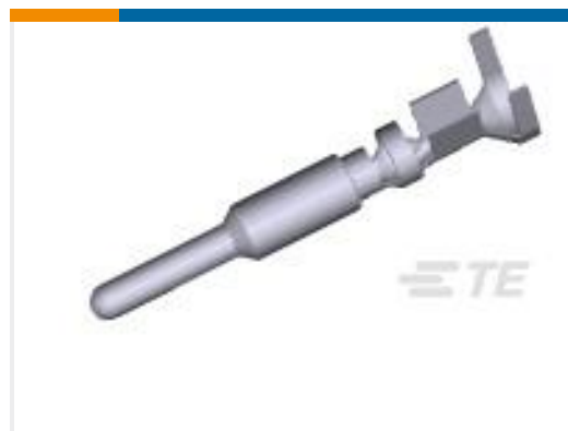
TE 产品编号1-770194-0 UMNLI GRND PIN DUPL AUBR LF