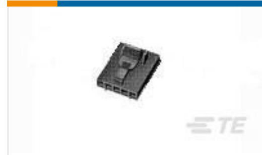
TE 产品编号104257-2 03 MTE RCPT HSG SR LATCH .100