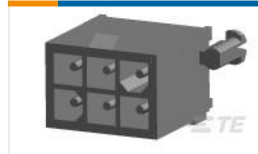
TE 产品编号1-770178-1 06P MINI UMNL ASSY VO SNAU LF