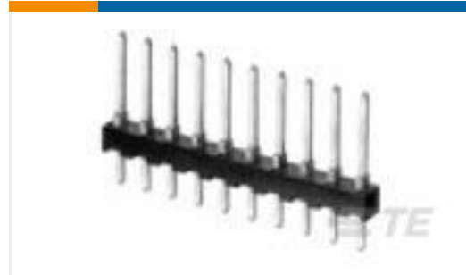
TE 产品编号87224-2 02 MODII HDR SRST UNSHRD .100