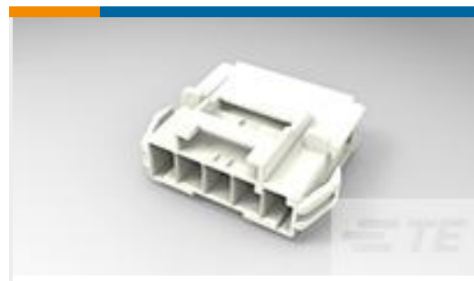
TE 产品编号1-1971772-7 PTL 1X5 CAP PANEL MT STD TEMP KEY A NAT