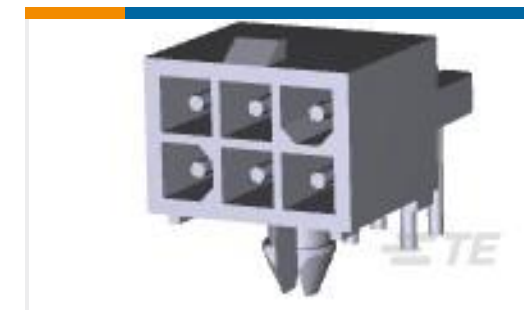
TE 产品编号1-770969-1 06P MINI UMNL R/A HDR ASSY LF