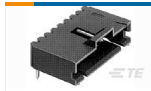
TE 产品编号103635-3 04 MTE HDR SRRA LATCH .100CL