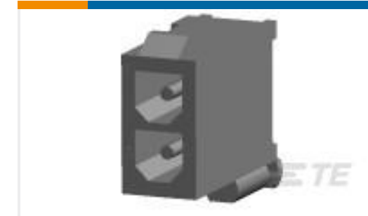
TE 产品编号1-770166-1 02P MINI UMNL ASSY VO SNAU LF