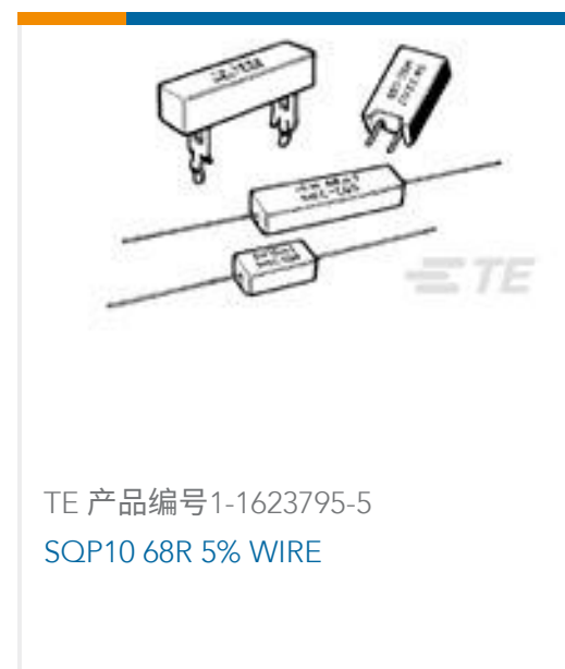
TE 产品编号1-1623795-5 SOP10 68R 5% WIRE