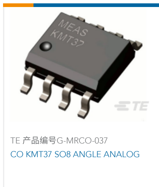
TE 产品编号G-MR037 CO KMT37 SO8 ANGLE ANALOG