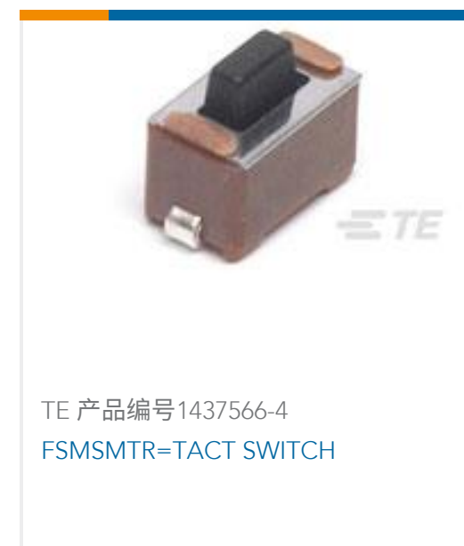
TE 产品编号1437566-4 FSMSMTR=TACT SWITCH