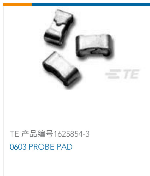
TE 产品编号1625854-3 0603 PROBE PAD