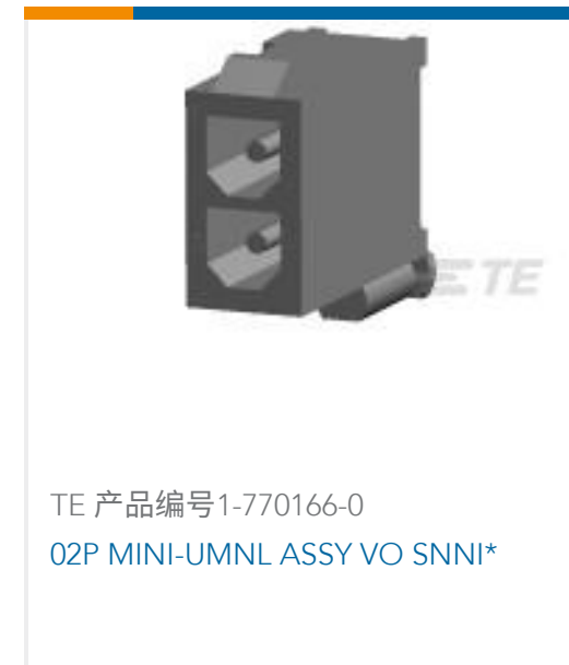
TE 产品编号1-770166-0 02P MINI-UMNL ASSY VO SNNI*