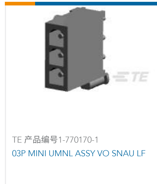
TE 产品编号1-770170-1 03P MINI UMNL ASSY VO SNAU LF