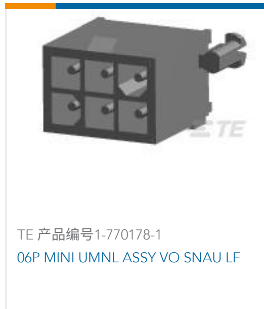
TE 产品编号1-770178-1 06P MINI UMNL ASSY VO SNAU LF