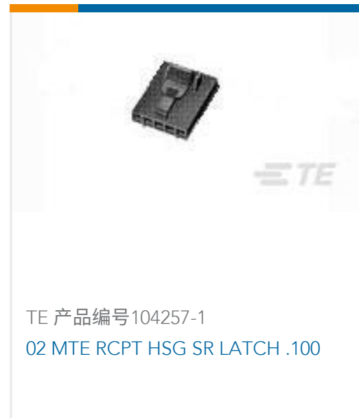
TE 产品编号104257-1 02 MTE RCPT HSG SR LATCH .100