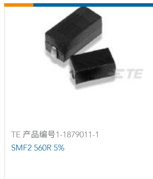
TE 产品编号1-1879011-1 SMF2 560R 5%