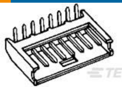
TE 产品编号 280382-1 15P MODU II SHRD HDR, RT ANG, TIN