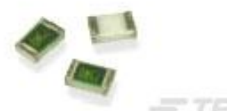
TE 产品编号 6-1879127-7 RN 0402 422R 0.1% 10PPM CUT LENGTH