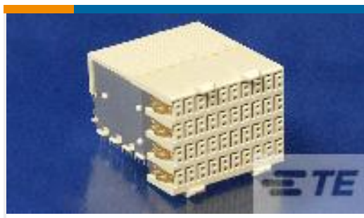
TE 产品编号2065657-1 zd Plus, 4 pair, receptacle assy