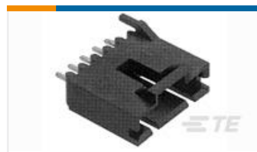
TE 产品编号104809-5 06 MTE HDR SRST LATCH W/HLDWN