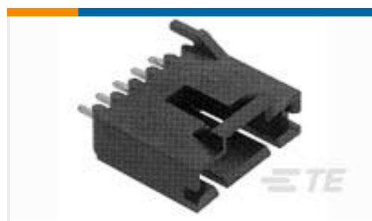
TE 产品编号104809-1 02 MTE HDR SRST LATCH W/HLDWN