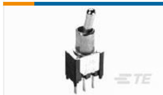
TE 产品编号2-1437561-3 TT11AGPC1=SW TOGGLE W/GOLD PC