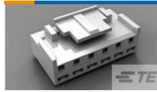
TE 产品编号2-1123722-3 3.96 EP PLUG HSG 3P(YELLOW)