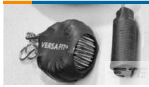
TE 产品编号938365P002 VERSAFIT-1/8-0-0.75IN-ST