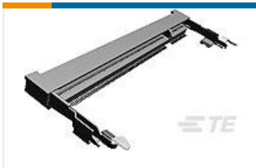
TE 产品编号1473149-4 SEMI-HARD TRAY ASSY DDR2 SODIMM 5.2H ST