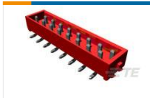
TE 产品编号1-338728-0 MICROM. MOB SMD CON