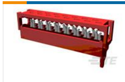
TE 产品编号1-215083-0 MICRO-MATCH MOW.10P