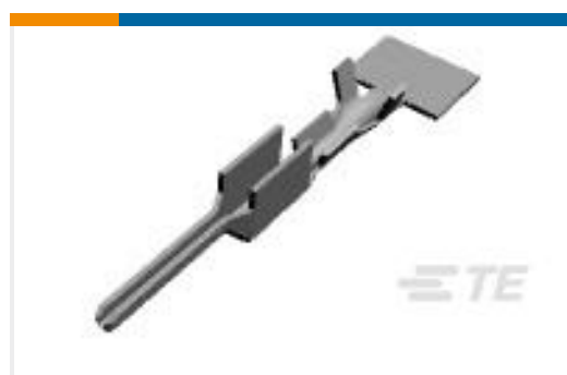
TE 产品编号1-794609-0 PIN CONT 26-30 TIN PLATE STRIP