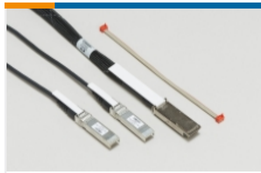
插拔式 I/O 电缆部件(52)