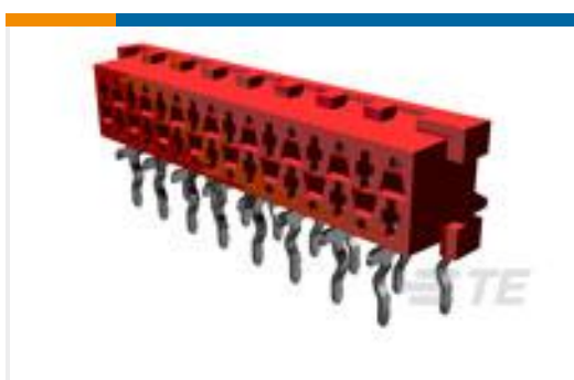
TE 产品编号7-215460-4 MICRO-MATCH FSID P