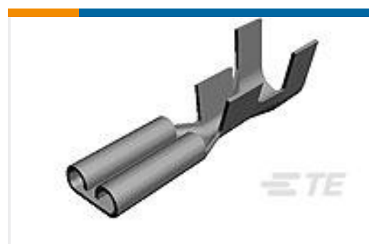
TE 产品编号160625-2 110 FASTON,REC.,20-17 AWG,TPBR