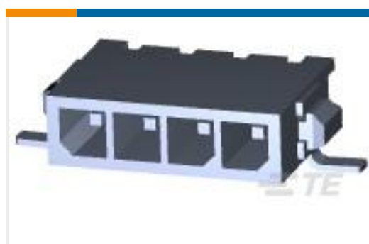
TE 产品编号2029030-4 4P MICRO MNL HDR ASY SR SIDE L