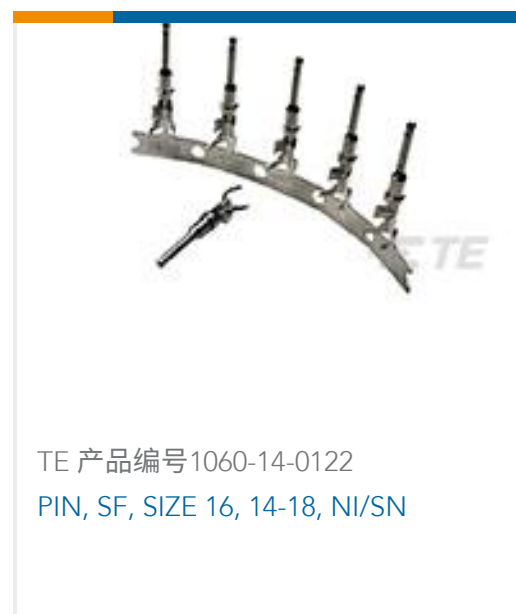
TE 产品编号1060-14-0122 PIN, SF, SIZE 16, 14-18, NI/SN