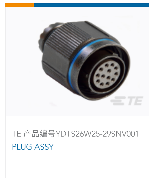
TE 产品编号YDTS26W25-29SNV001 PLUG ASSY