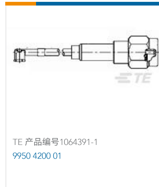
TE 产品编号1064391-1 9950 4200 01