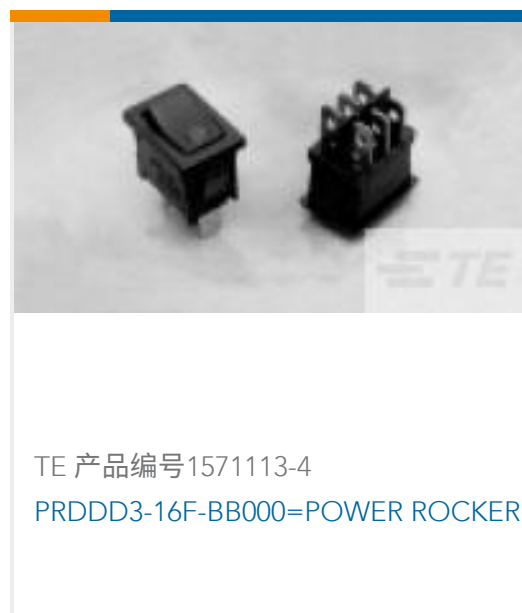
TE 产品编号1571113-4 PRDDD3-16F-BB000=POWER ROCKER