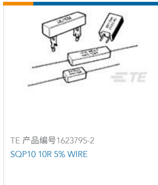
TE 产品编号1623795-2 SQP10 10R 5% WIRE