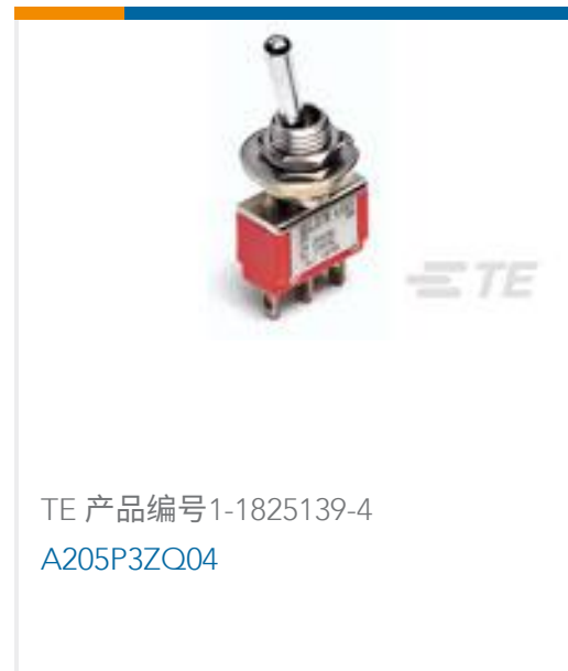
TE 产品编号1-1825139-4 A205P3ZQ04