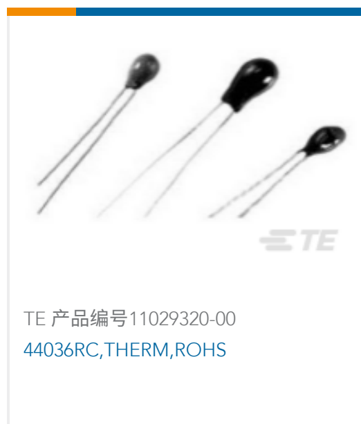
TE 产品编号11029320-00 44036RC,THERM,ROHS