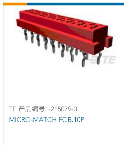
TE 产品编号1-215079-0 MICRO-MATCH FOB.10P