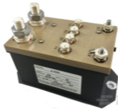
TE 产品编号4-1616058-3 A770WA3 (FAA/PMA)=RELAY