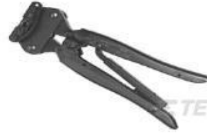
TE 产品编号69376-1 SADAHT TNC RG-58A 58C ASSY