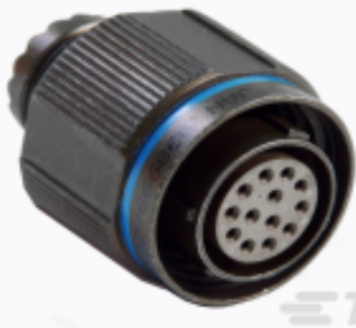
TE 产品编号YACT26JB02SAV00100 STRAIGHT PLUG