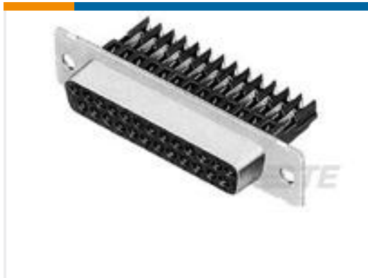
TE 产品编号1-745497-7 RCPT ASSY,37P,HDE,MS