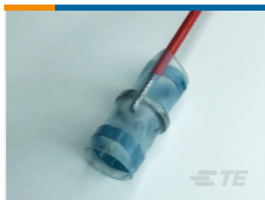
TE 产品编号627567N001 D-146-50-4CS1370