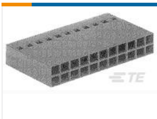
TE 产品编号1-104482-7 38 SHORT PT RCPT HSG DR .100CL