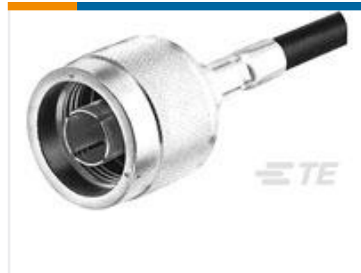
TE 产品编号1-225092-1 SERIES N PLUG W/PROOF