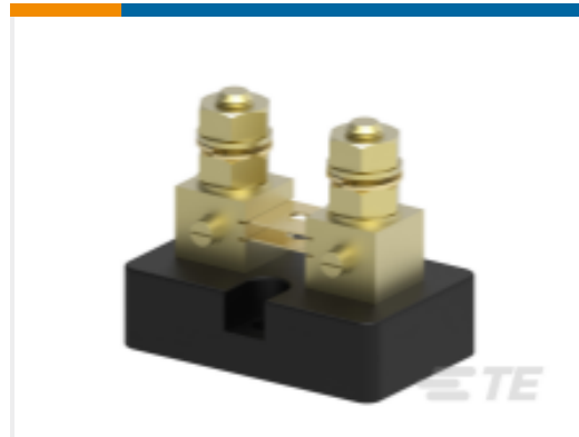
TE 产品编号CG3313-000 CI-TM3050