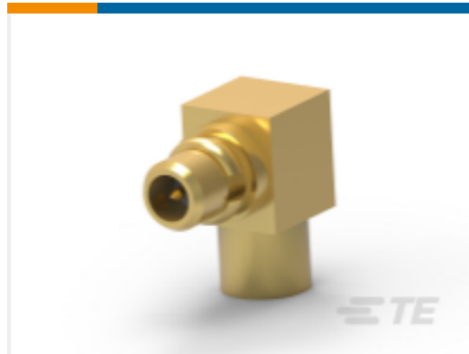
TE 产品编号1408314-1 MMCX RIGHT ANGLE PLUG, SEMI-RI