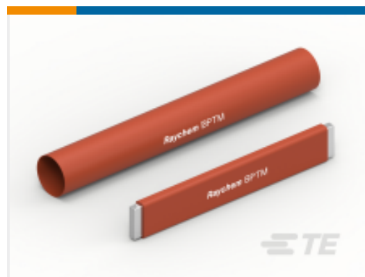
TE 产品编号312391-000 BPTM-205/110-A/U(B50)