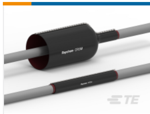
TE 产品编号BM1269-000 CRSM-34/10-150-CONED