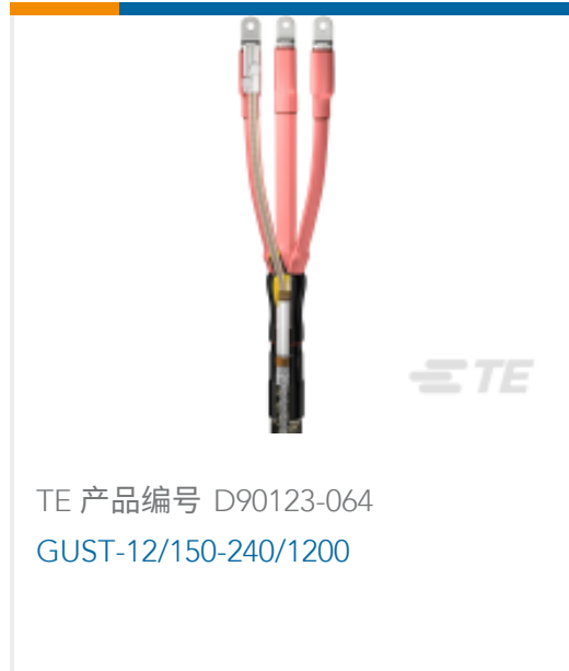
TE 产品编号 D90123-064 GUST-12/150-240/1200