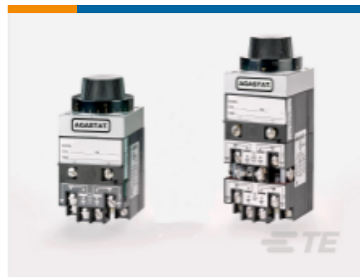
TE 产品编号3-1423165-1 7024JCT=RLY,STD,OFF,4P,208V,15S,T