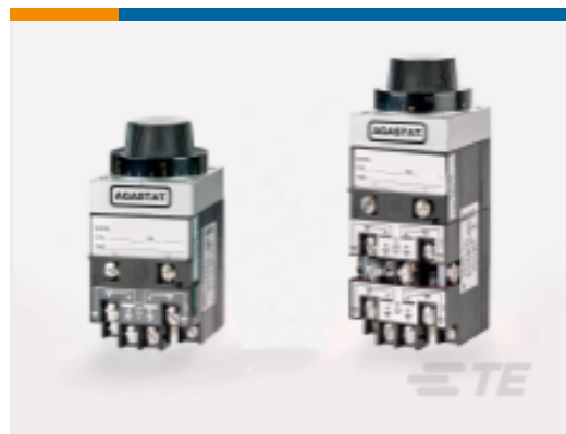
TE 产品编号2-1472995-9 7012NBLL=RLY,STD,ON,2P,48V,5S,LL