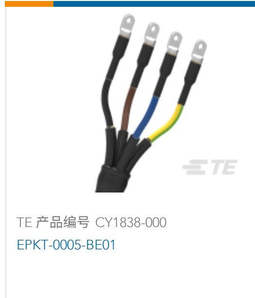
TE 产品编号 CY1838-000 EPKT-0005-BE01