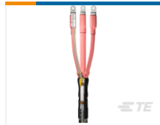
TE 产品编号A31452-070 GUST-12/70-120/800-L12