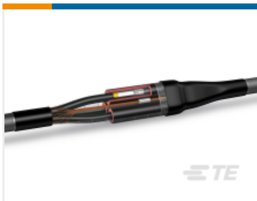
TE 产品编号A69078-064 POLJ-12/3X70-150