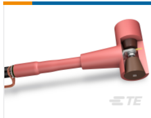
TE 产品编号555340-070 RICS-5123