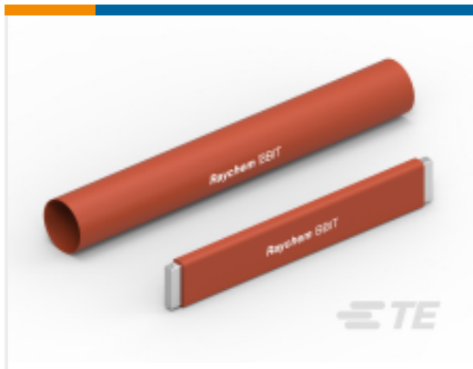
TE 产品编号560936-000 母线绝缘管高达 35 kV