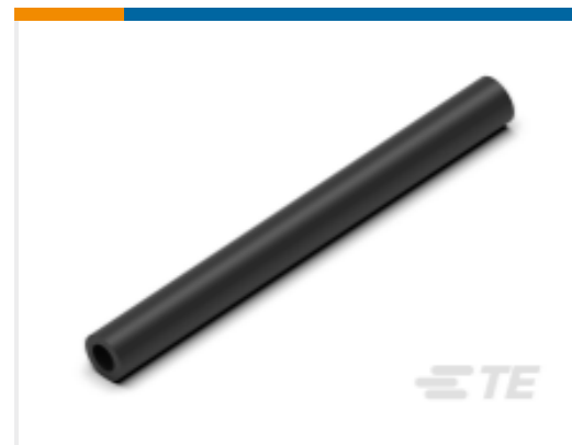
TE 产品编号CN5946-000 EN-CGAT-6/2-0-1200