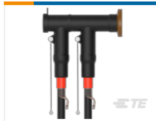
TE 产品编号CM0097-005 RSTI-CC-5854