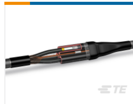
TE 产品编号D11309-070 POLJ-12/3X25-70