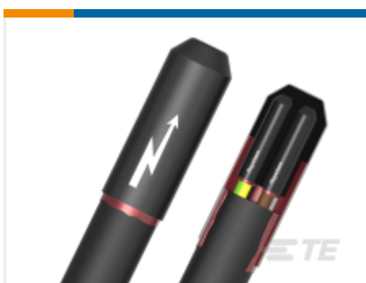
TE 产品编号248047-000 EPKE-0064-DE01