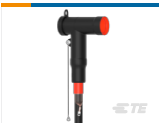
TE 产品编号CM0012-005 RSTI-5854