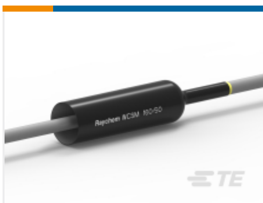
TE 产品编号135998-1 厚壁热缩管