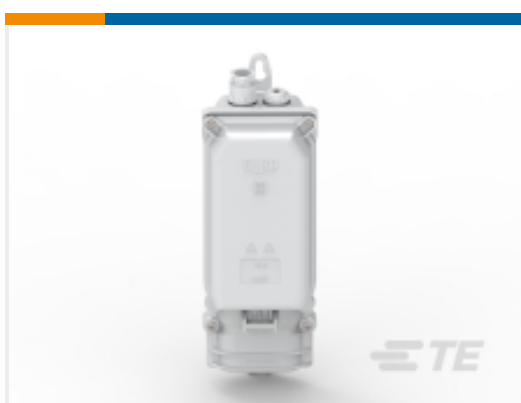
TE 产品编号523562-000 EKM-1281S-2D1-5S/U-2PG-C2