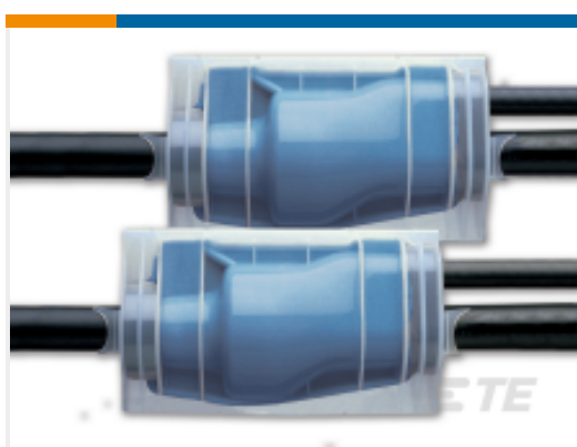
TE 产品编号F24445-000 RAPID-3-D245