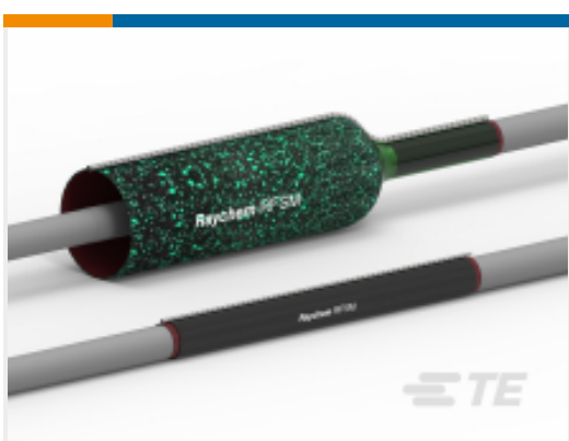
TE 产品编号310667-000 RFSM-95/30-500/123