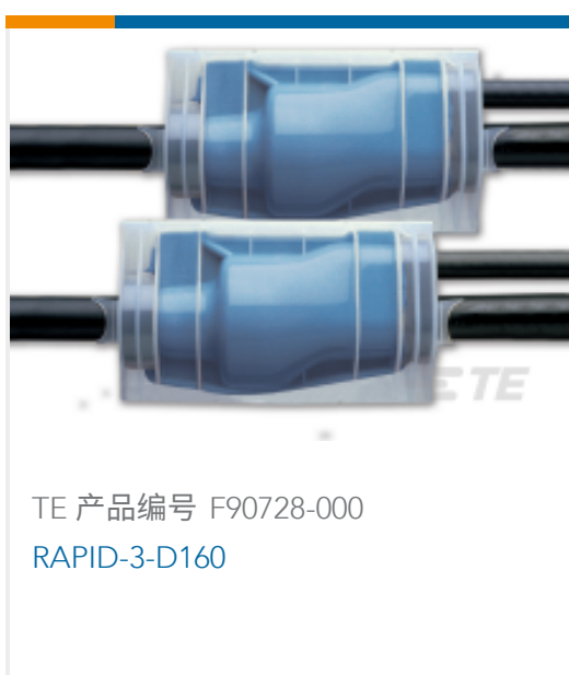
TE 产品编号 F90728-000 RAPID-3-D160