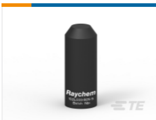
TE 产品编号BM5711N002 102L044-R05/S(S25)