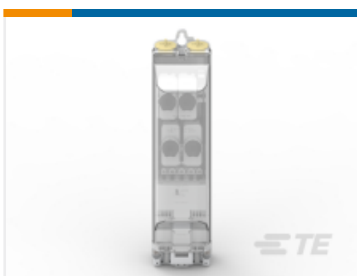
TE 产品编号820560-000 EKM-2051-4D1-5S/U-RK