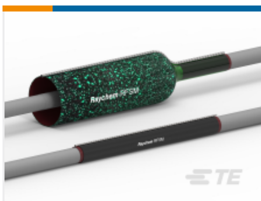
TE 产品编号186312-000 RFSM-95/30-750/123