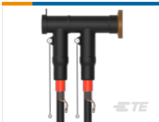
TE 产品编号CM0097-005 RSTI-CC-5854