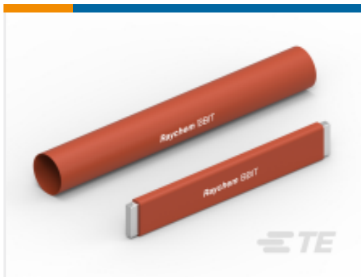
TE 产品编号560936-000 母线绝缘管高达 35 kV