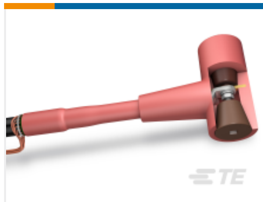
TE 产品编号555340-070 RICS-5123