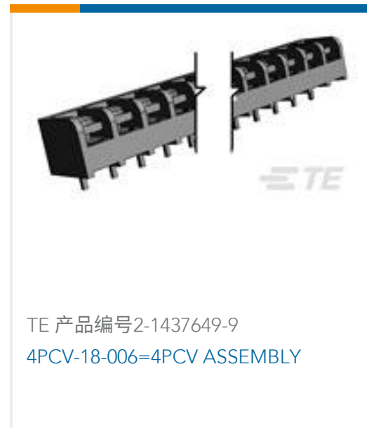
TE 产品编号2-1437649-9 4PCV-18-006=4PCV ASSEMBLY