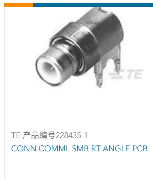
TE 产品编号228435-1 CONN COMML SMB RT ANGLE PCB