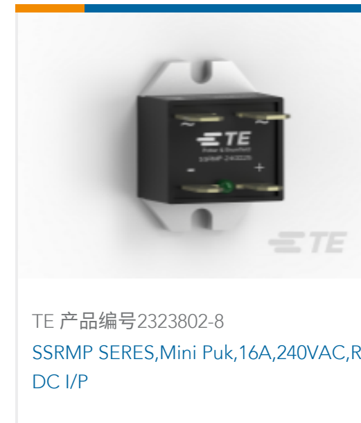
TE 产品编号2323802-8 SSRMP SERIES, Mini Puk, 16A, 240VAC, R-DC I/P