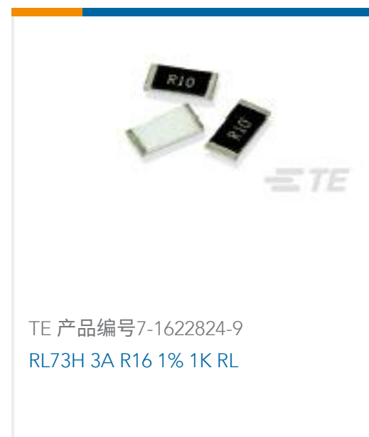
TE 产品编号7-1622824-9 RL73H 3A R16 1% 1K RL