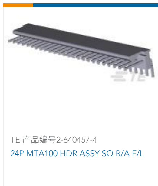
TE 产品编号2-640457-4 24P MTA100 HDR ASSY SQ R/A F/L