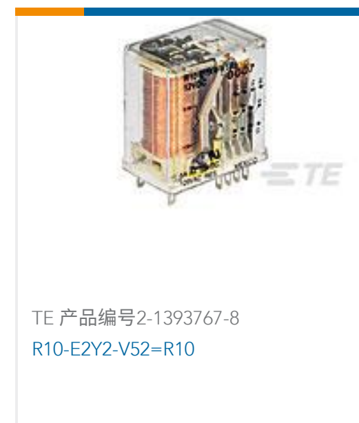
TE 产品编号2-1393767-8 R10-E2Y2-V52=R10