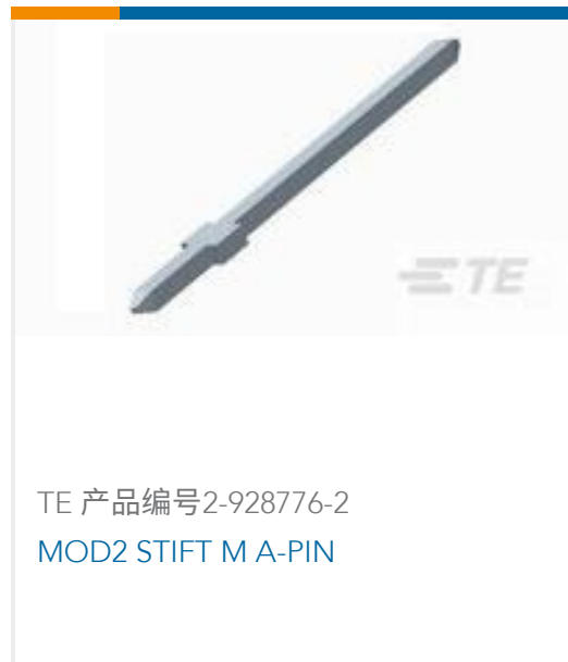
TE 产品编号2-928776-2 MOD2 STIFT M A-PIN