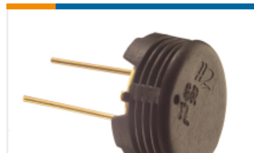
TE 产品编号HPP801A031 HS1101LF HUMIDITY SENSOR