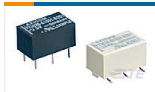
TE 产品编号1393774-8 V23026A1002B201