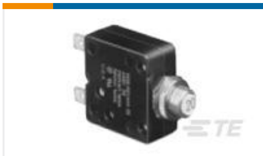
TE 产品编号1393249-5 W58-XB1A4A-1=W58