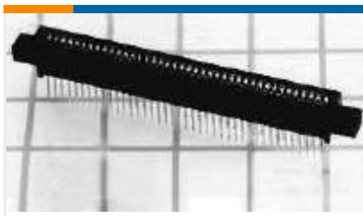
TE 产品编号5530841-5 CONN SEC II 25 POS 100C/L