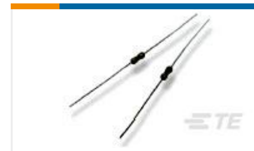
TE 产品编号1623708-8 RGP0207CH 5% 47M