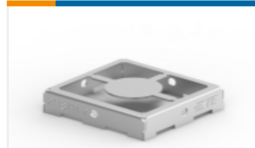
TE 产品编号2118714-2 STD SHIELD FRAME, CRS-13.66X12. 70X2.54MM