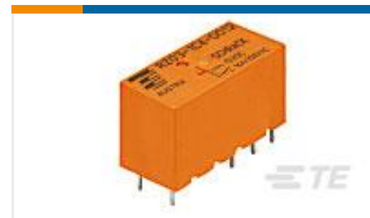
TE 产品编号3-2158000-5 RZ01-1A4-D005-R