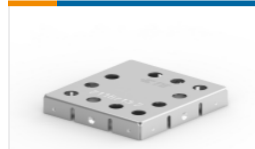
TE 产品编号2118713-2 STD SHIELD COVER, CRS-14.06X13. 10X2.00MM