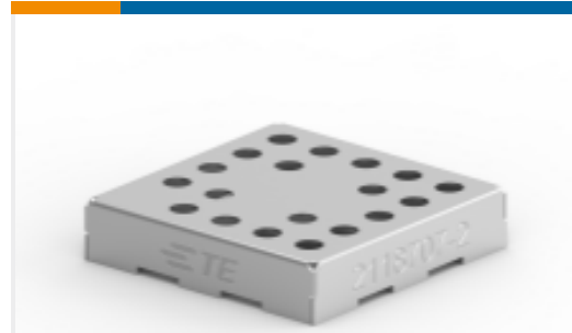
TE 产品编号2118707-2 1 PC STD SHIELD, CRS-16.50X16.50X3. 60MM