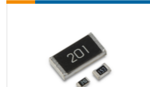
TE 产品编号2176328-7 CRGP 1206 33R 1%