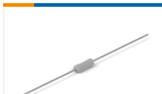
TE 产品编号3-1676123-9 1/2W SM M/OX 5% 33R