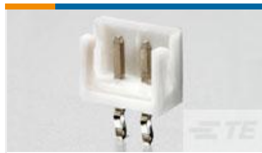
TE 产品编号440052-5 2.5MM,HDR,5POS,VERTICAL, CONNECTOR