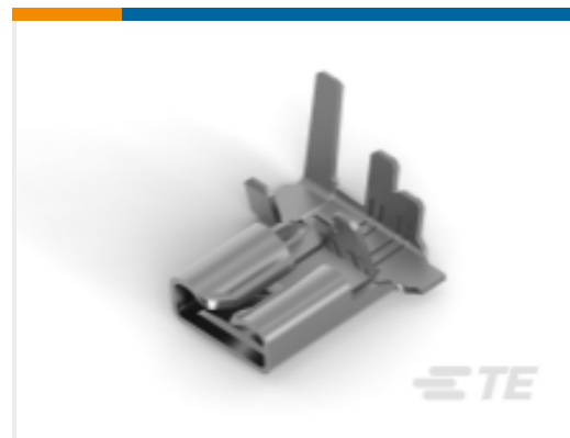
TE 产品编号 2238171-3 250 FASTON,FLAG,REC.,22-12 AWG, TPBR