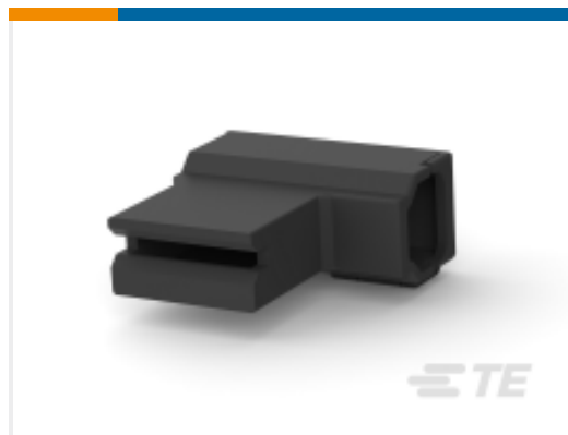
TE 产品编号 1969657-1 250 FASTON HSG.,FLAG,REC.,1 POS, BLACK