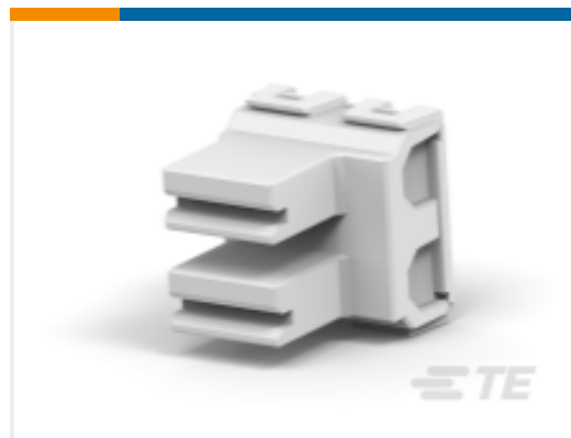
TE 产品编号 1969900-1 250 FASTON HSG.,FLAG,REC.,2 POS, NATURAL