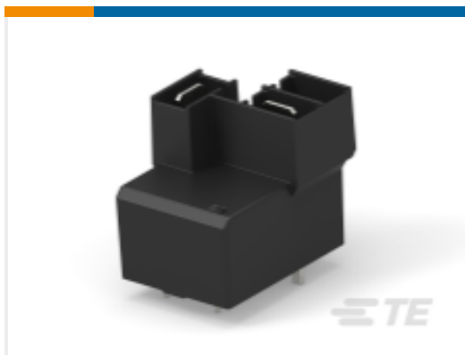
TE 产品编号 1-1558676-7 T9GS1L24-24WG