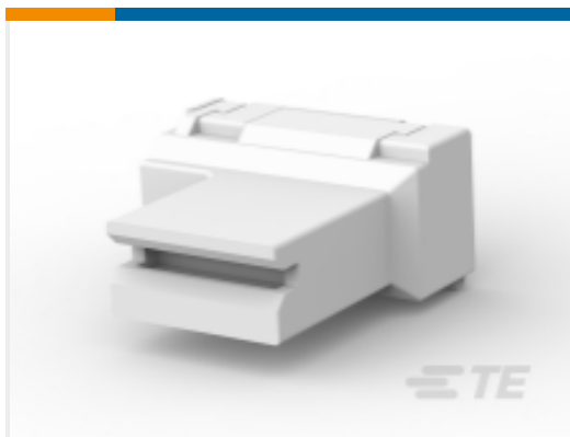
TE 产品编号 1969656-1 250 FASTON HSG.,FLAG,REC.,1 POS, NATURAL