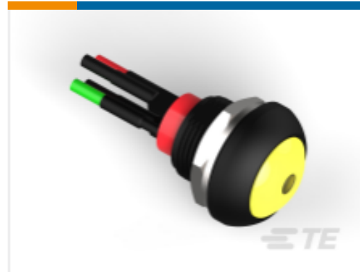
TE 产品编号1-2329389-1 PB OFF/ON FC YLW M1 TERM WHI LED IP68 50