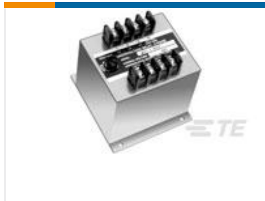
TE 产品编号2-1618108-3 WOV-3-440=WILMAR OVERVOLTAGE 4