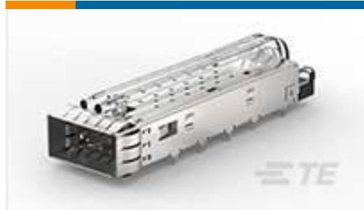
TE 产品编号2170773-1 CAGE ASSY, QSFP28 1X1, SPRING, LP