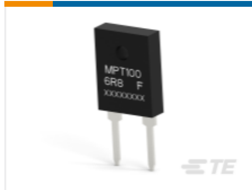
TE 产品编号2176429-5 MPT100 R47 5%