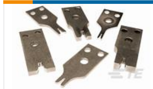
TE 产品编号2-456406-5 WIRE CRIMPER .090