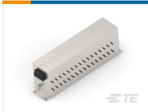
TE 产品编号2-1609998-3 KEV 42A 2S SP WYE BS 440VAC