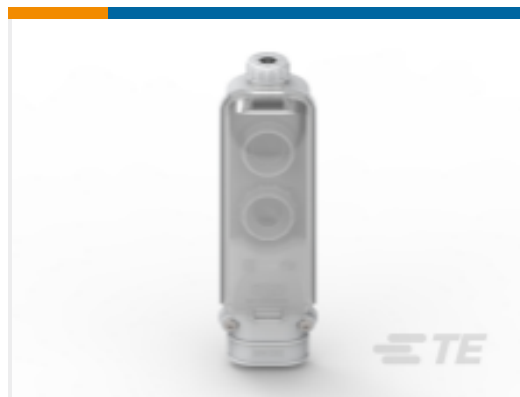
TE 产品编号541838-000 EKM-1272-2D2-4X16