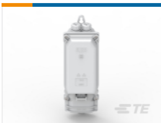
TE 产品编号612804-000 EKM-1281-1D2-5X25-2PG-C2