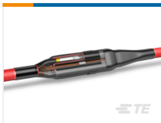
TE 产品编号A76235-000 TRAJ-01/4X150-240/45B