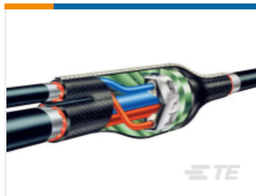
TE 产品编号728079-000 BMHM-1001-4D2