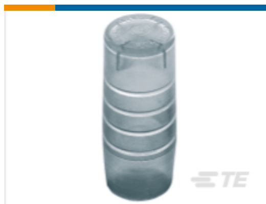
TE 产品编号CN1960-000 GURO-CEC-8/12