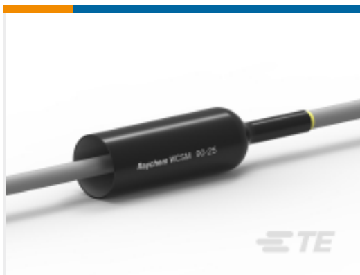
TE 产品编号CU4599-000 WCSM-90/25-700/S(S5)