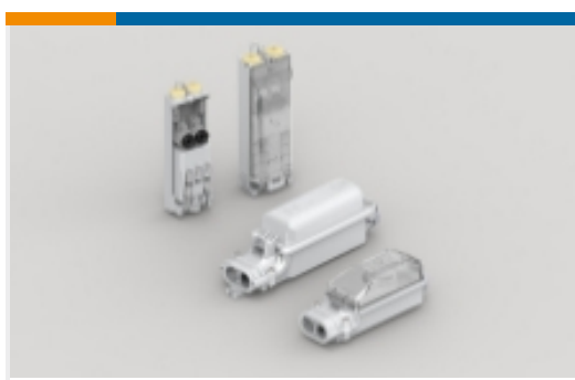
街道照明保险丝盒(201)