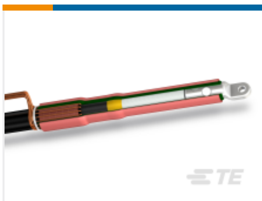
TE 产品编号CF6274-070 POLT-12C/1XI-ML-1-13