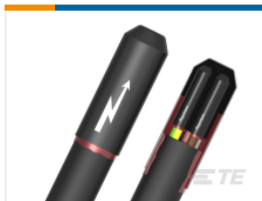
TE 产品编号720505-000 EPKE-0064-(S25)