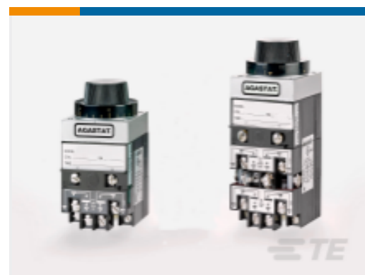
TE 产品编号 1755170-1 7022OCIM=RLY,STD,OFF,2P,24V,15S,I, M