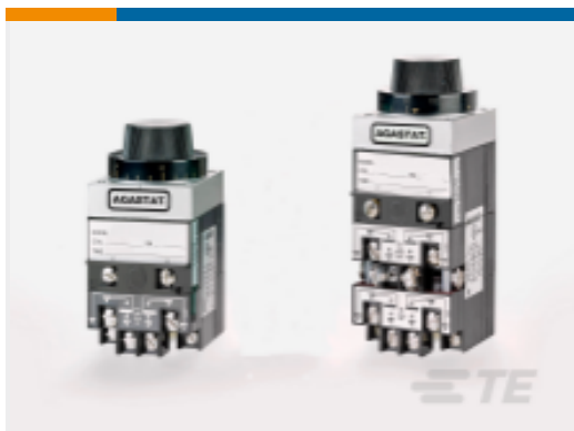
TE 产品编号 2-1423162-9 7022BK=RLY,STD,OFF,M2P,240VAC,