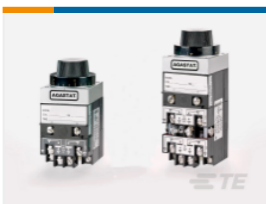
TE 产品编号 1423168-5 E7012AC004=RLY,NUC,ON,2P,120V