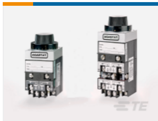
TE 产品编号1755170-1 7022OCIM=RLY,STD,OFF,2P,24V,15S,I,M