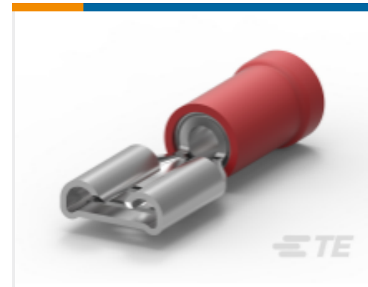
TE 产品编号1856390-8 Clip FASTON R 6,3x0,8 Lait eta