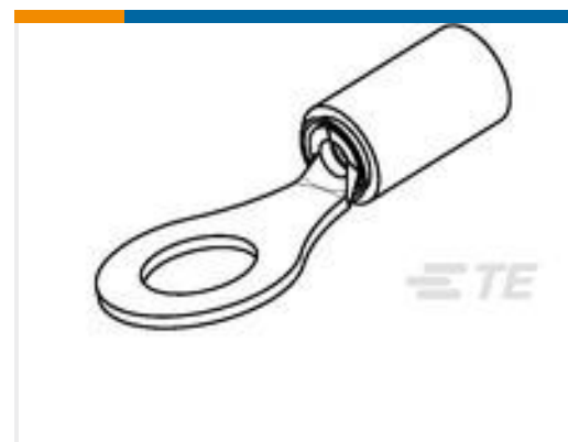
TE 产品编号1577641-1 TERMINAL, PEEK PIDG STRATO, 14-12AWG