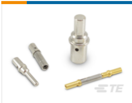
TE 产品编号0462-201-20141 DEUTSCH 实芯端子