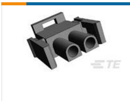
TE 产品编号1-480698-0 02P UMNL PLUG HSG NATL