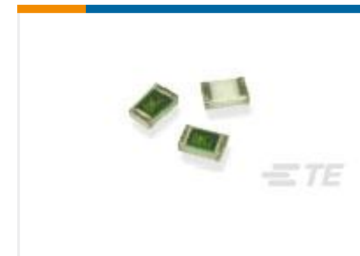
TE 产品编号1676288-2 RN 0805 2K37 0.1% 10PPM 1KRL