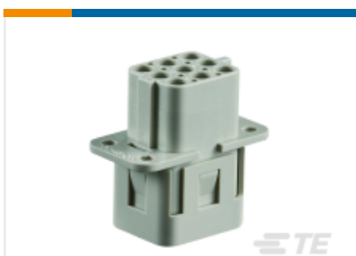
TE 产品编号T2019092201-000 HQ-008-F