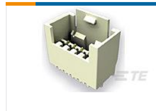
TE 产品编号1-1971921-3 2/3P,RAST 2.5 Tab Header,Ex- Locking, THV