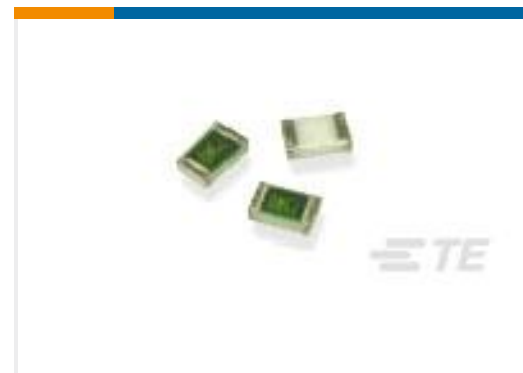
TE 产品编号1-1879134-4 RN 0603 13K3 0.1% 10PPM 1K RL