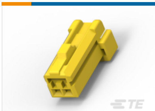
TE 产品编号174056-1 040 MLC 2POS PLUG HSG