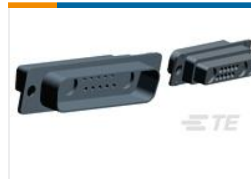
TE 产品编号208810-2 PLUG ASSY,COAX MIX,AMPLIMITE