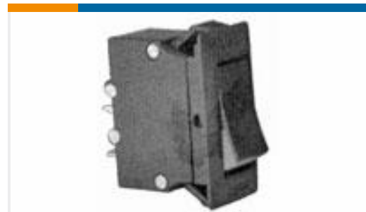
TE 产品编号1423673-1 W51-A121B1-5=CKTBKR,THERM, ROCK