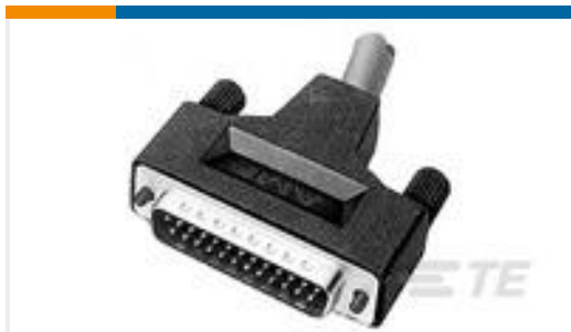
TE 产品编号1-747946-6 KIT,PLUG,15P,HDE,SHLD ENCLSR