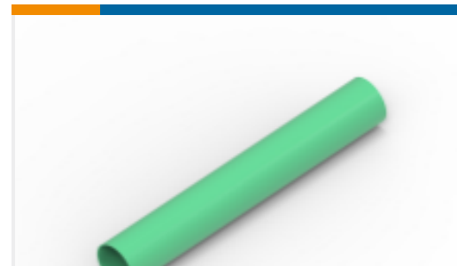
TE 产品编号NB19262001 RNF-100-1/8-GN-STK