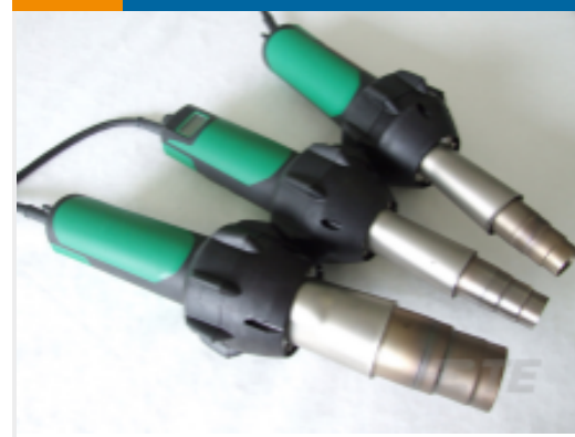
TE 产品编号 EG1114-000 CV1981-ST-230V1600W-EU