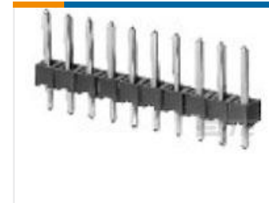
TE 产品编号146281-4 04 MODII HDR SRST B/A .100CL