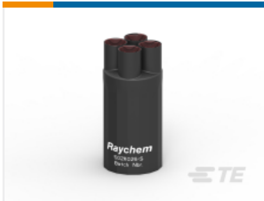
TE 产品编号146368N001 502K026/S(C40)