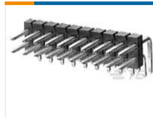
TE 产品编号2-102975-5 50 MODII HDR DRRA B/A .100CL