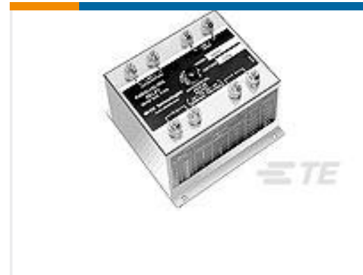
TE 产品编号1-1618065-4 1810DDBX=WILMAR PARALLELING RE