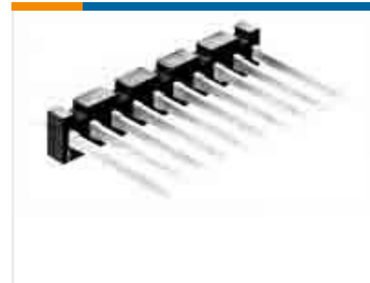
TE 产品编号86469-5 05 MODII HDR SRST .156CL