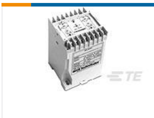
TE 产品编号1618058-2 WD25-002=RELAY, PARALLELING, 1