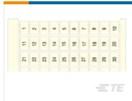
TE 产品编号1SNA231060R0200 RC510 1->100 VERTICAL