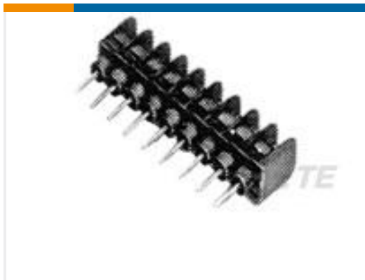
TE 产品编号1776346-1 JC6-P105-25=JC6 ASSEMBLY