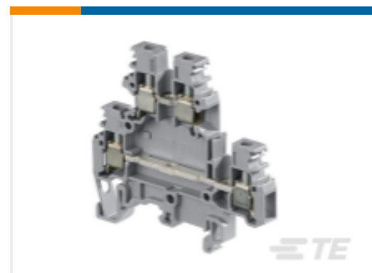
TE 产品编号1SNA115271R2200 M4/6.D2