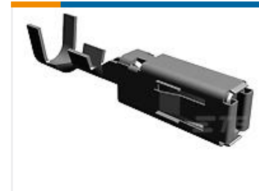
TE 产品编号1-968855-3 AMP MCP 2.8, CONTACT SWS