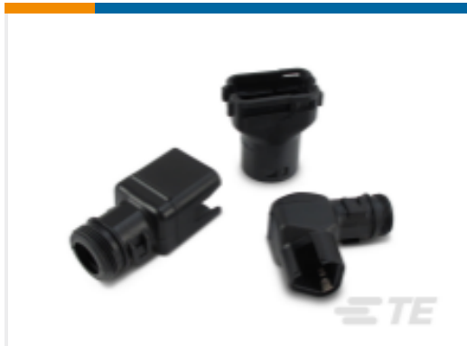
TE 产品编号1011-257-0205 DEUTSCH DT 后盖