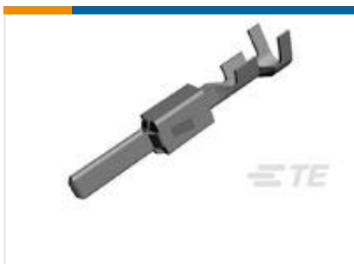
TE 产品编号1-962916-3 TAB 2.8x0.8 CONTACT CS SWS Au