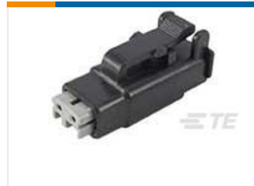
TE 产品编号DTMH06-2SA PLG, 2P, BLK, N, HI TEMP, A