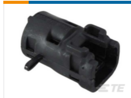
TE 产品编号1028-041-0205 BKSHL, 2P, BLK, PLG, ST, NW 8.5