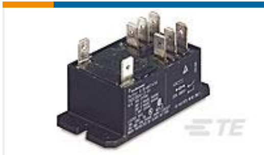
TE 产品编号4-1393211-0 T92P11A22-120