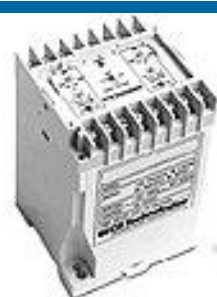
TE 产品编号 2-1618058-6 WD5051-001=RELAY, OVERCURRENT