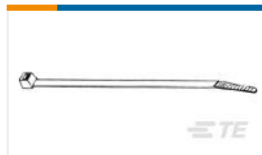
TE 产品编号2-604771-9 CABLE TIE, NATURAL, 4" (1000)