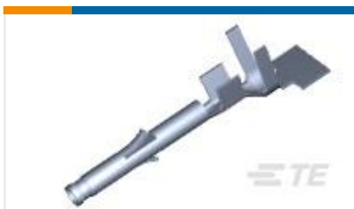
TE 产品编号171639-1 MINI U-M-N-L SOCKET L.P