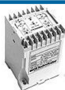
TE 产品编号 2-1618058-7 WD5051-002=RELAY, OVERCURRENT