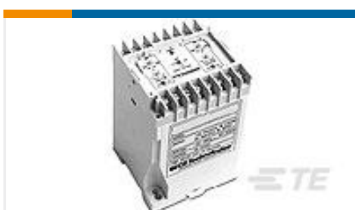
TE 产品编号3-1618058-1 WD5051-3-003=RELAY, 3PH, OVRCU