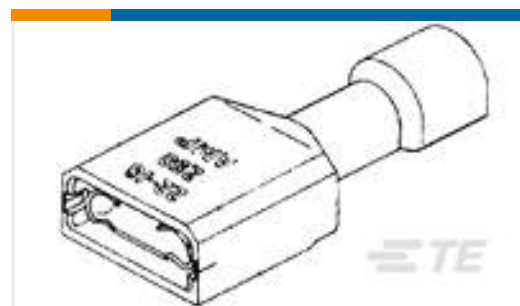
TE 产品编号2-520184-2 ULTRAFAST 250 ASSY REC 22-18 TPBR LP