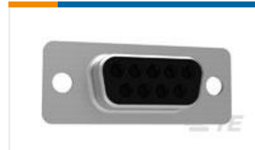
TE 产品编号5-747905-2 9 Rcpt Solder Cup, Gold Flash,