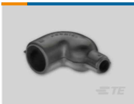
TE 产品编号806823-000 球形热缩护套：有嘴，直角