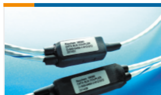
TE 产品编号 A85351-000 D-500-0255-431