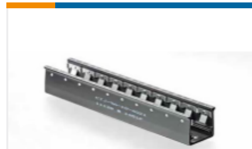
TE 产品编号 CTJ-3A-05 RAIL ASSY