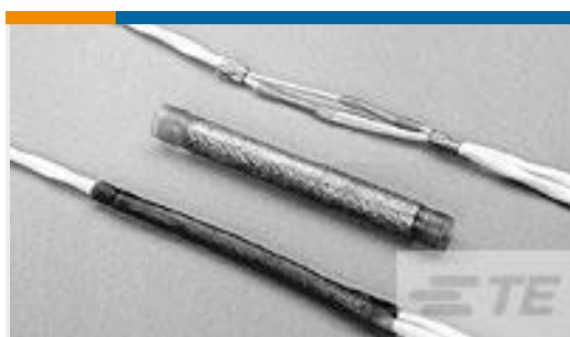
TE 产品编号 626967-000 D-153-6004