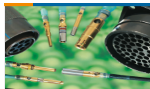
TE 产品编号 132627-000 D-602-44CS1024