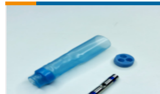
TE 产品编号 CU3031-000 D-200-89