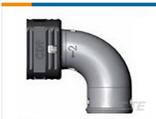
TE 产品编号ZPF000000000102764 787-8055-30M