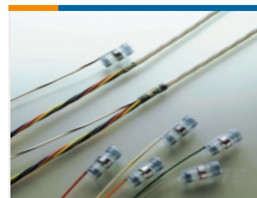
TE 产品编号365717N001 S02-20-R-4CS1093