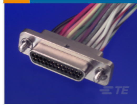
TE 产品编号2-1532184-8 M83513/03-F12C, MCKS-C2-B-37P6Q9-36.0