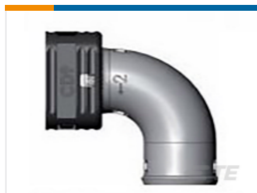
TE 产品编号ZPF00000000102764 787-8055-30M