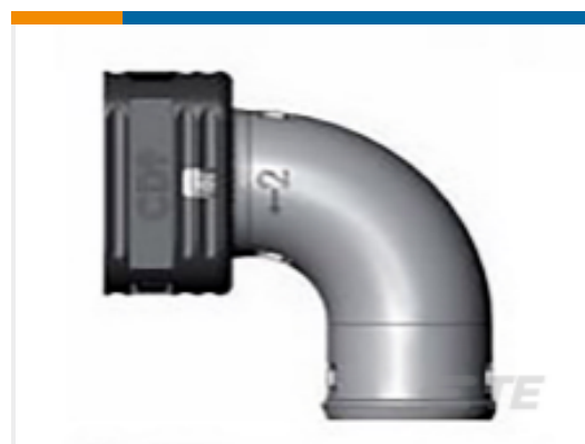
TE 产品编号ZPF000000000102764 787-8055-30M