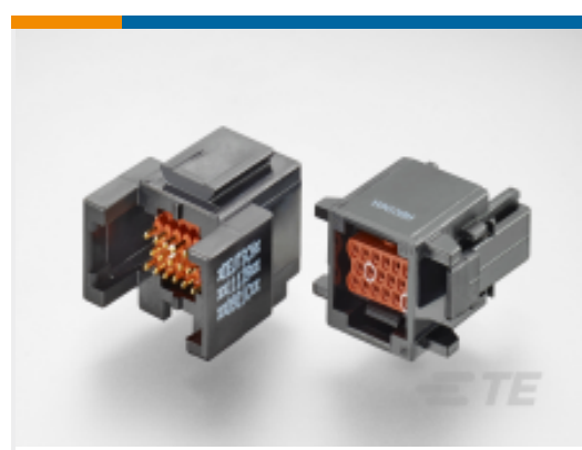
TE 产品编号ABC06N-22P IN-LINE PLUG