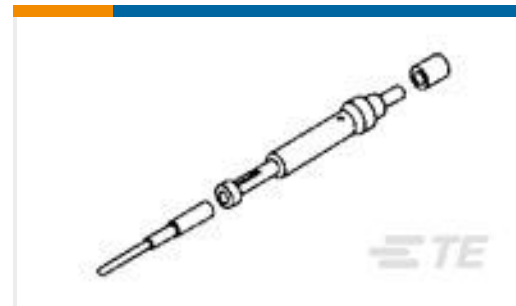
TE 产品编号226781-1 ARINC SIZE 15 SOCKET