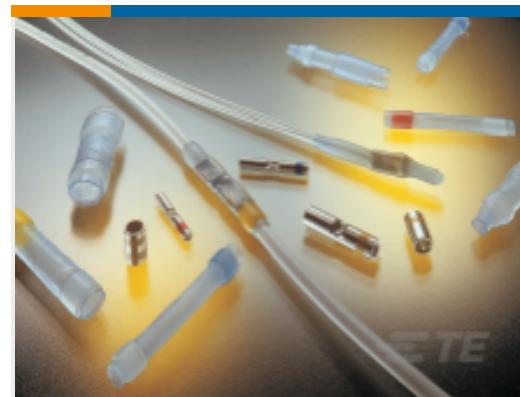
TE 产品编号650131N003 D-436-87CS2705