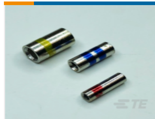
TE 产品编号486341-000 D-609-04CS391