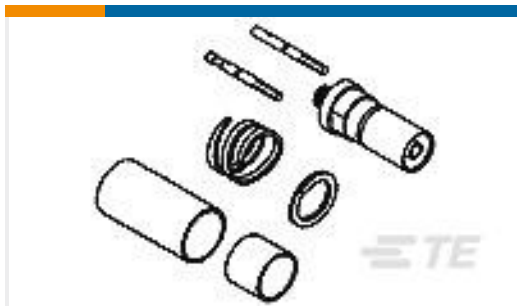
TE 产品编号446549-1 KIT,CONTACT,SOCKET,ARINC,SZ 1