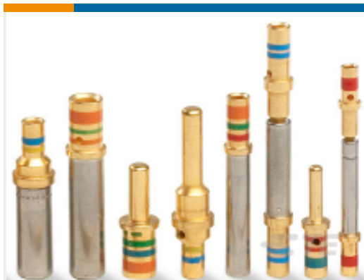
TE 产品编号2560-212-2231 CONT PIN