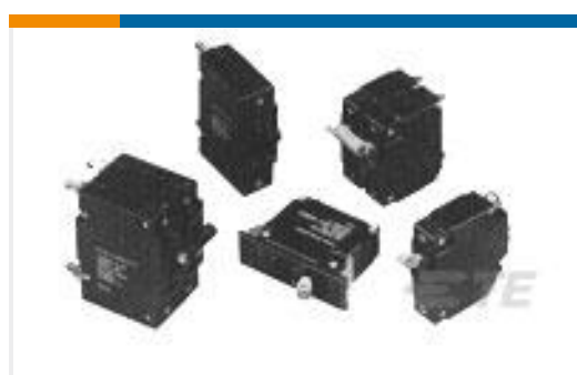
TE 产品编号 1-1393255-2 W93-X112-5=M6/M7/M9/W6/W7