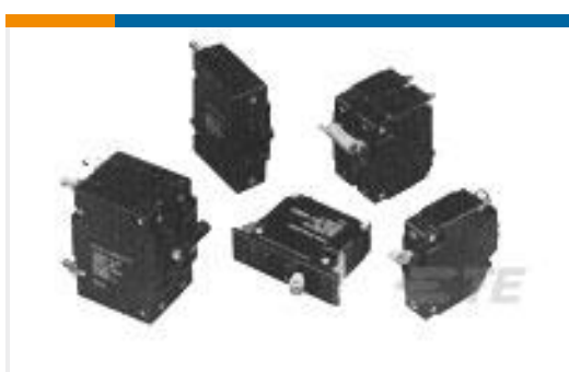
TE 产品编号 2-1393254-5 W91-X112-20=M6/M7/M9/W6/W7