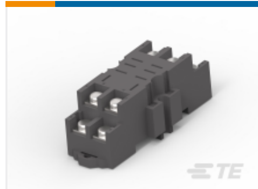
TE 产品编号 2-1419106-7 27E895=SOCKET,K10,8,OC,POLY,NA