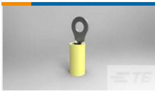
TE 产品编号 2-36161-3 TERMINAL,PIDG R IR 12 10