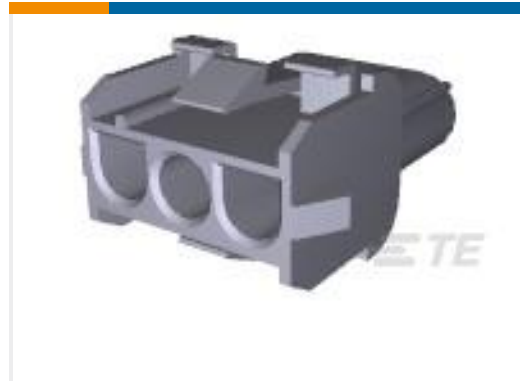
TE 产品编号 1-480701-0 03P UMNL CAP HSG NATL