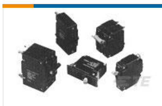
TE 产品编号 2-1393254-4 W91-X112-2=M6/M7/M9/W6/W7