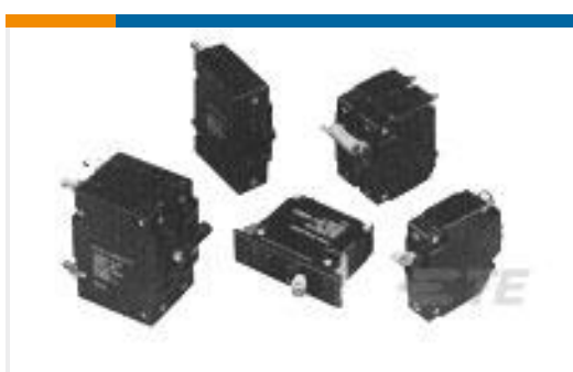
TE 产品编号 1393255-2 W93-X112-15=M6/M7/M9/W6/W7