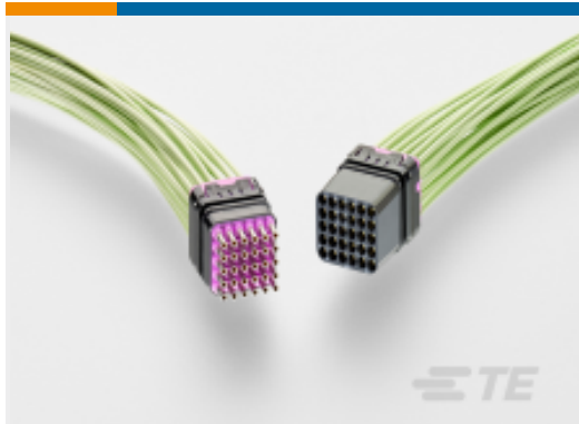
TE 产品编号 ZPF000000000202709 DMC-MR 30-23 SN