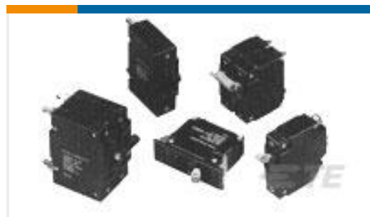
TE 产品编号 2-1393254-4 W91-X112-2=M6/M7/M9/W6/W7