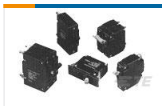
TE 产品编号 1393255-1 W93-X112-10=M6/M7/M9/W6/W7