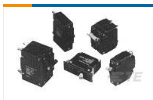
TE 产品编号 2-1393254-7 W91-X112-3=M6/M7/M9/W6/W7