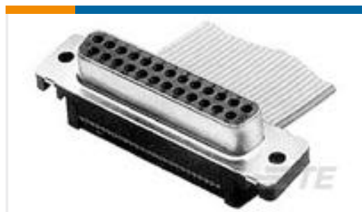
TE 产品编号 1658612-1 37 POS HDF RCPT, MS, LEAD FREE