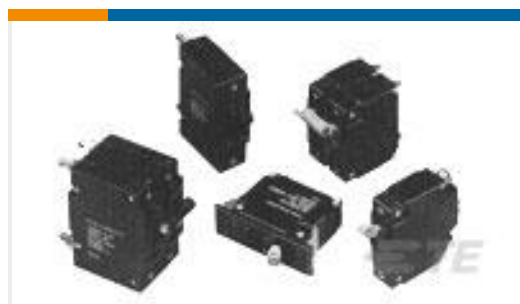
TE 产品编号2-1393254-3 W91-X112-15=M6/M7/M9/W6/W7