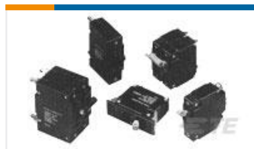
TE 产品编号2-1393254-6 W91-X112-25=M6/M7/M9/W6/W7