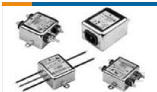
TE 产品编号1-6609028-9 20VK6=F7357 S0