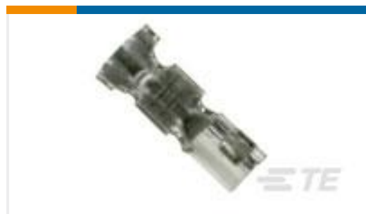
TE 产品编号 179227-4 AMP CT CRIMP-2 REC CONT AU