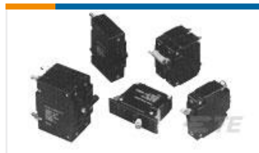
TE 产品编号 4-1393254-2 W91-X152-10=M6/M7/M9/W6/W7