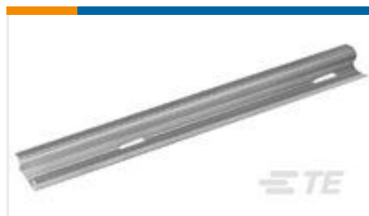
TE 产品编号1419111-6 24A110=TRACK,MOUNTING