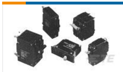
TE 产品编号 2-1393254-2 W91-X112-10=M6/M7/M9/W6/W7