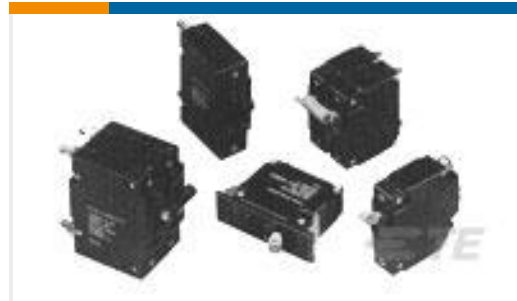
TE 产品编号 9-1393254-9 W93-X1110-50=M6/M7/M9/W6/W7