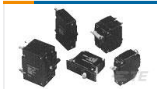
TE 产品编号1-1393255-0 W93-X112-40=M6/M7/M9/W6/W7