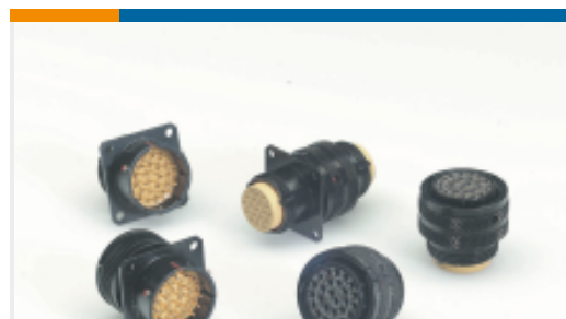
TE 产品编号ZPF000000000020086 FDBA 57-8-3A-SN-K-A499