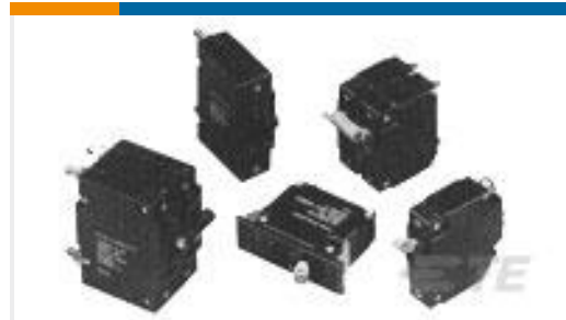
TE 产品编号1393255-8 W93-X112-30=M6/M7/M9/W6/W7