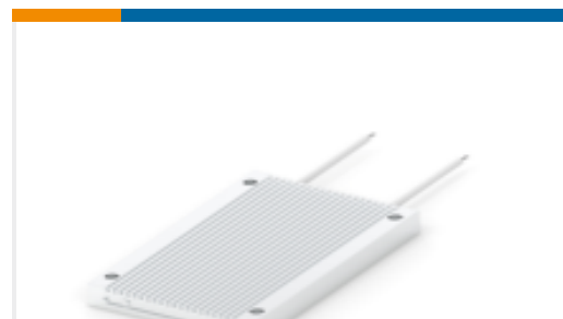
TE 产品编号1-2176250-7 TJT 500W 470R 5%