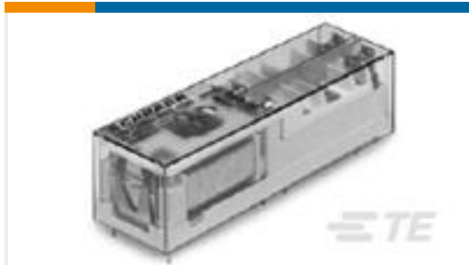
TE 产品编号1415015-1 SR6A4024 - V23050-A1024-A533