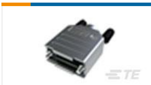
TE 产品编号1-2198617-5 Ni Plated Plastic Backshell, 15 Way, Str