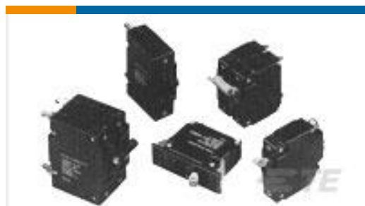
TE 产品编号1393255-4 W93-X112-20=M6/M7/M9/W6/W7