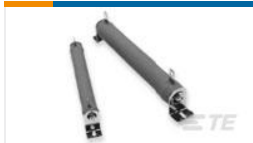
TE 产品编号1-1879457-7 TE 2500W 22R 5% Bracket