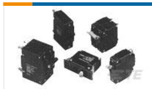
TE 产品编号2-1393254-3 W91-X112-15=M6/M7/M9/W6/W7