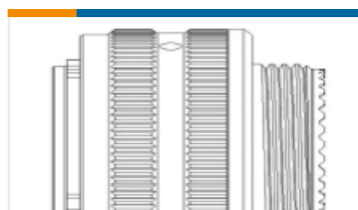
TE 产品编号YDJT16E23-35PAV001 PLUG ASSY