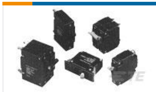
TE 产品编号 3-1393254-4 W91-X113-10=M6/M7/M9/W6/W7