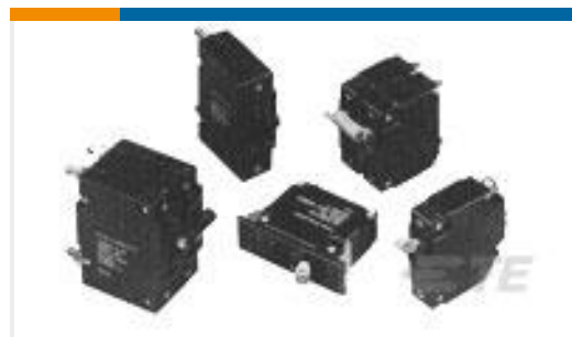
TE 产品编号 4-1393254-2 W91-X152-10=M6/M7/M9/W6/W7