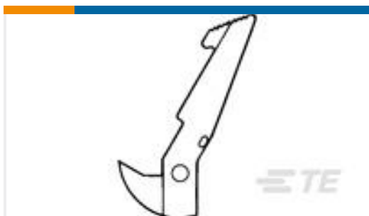
TE 产品编号111338-1 UNIVERSAL HEADER LATCH