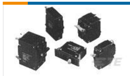
TE 产品编号 1-1393254-6 W91-X1110-10=M6/M7/M9/W6/W7