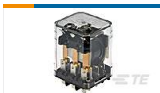
TE 产品编号 1393118-3 KUP-14A55-240=KU