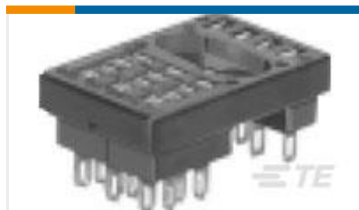
TE 产品编号 1393143-8 27E125=SOCKET,R10,10,SLG,PHE