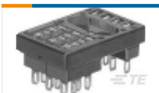
TE 产品编号 1393143-9 27E126=SOCKET,R10,16,SLG,PHE