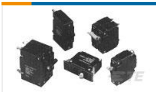
TE 产品编号 3-1393254-3 W91-X112-7=M6/M7/M9/W6/W7