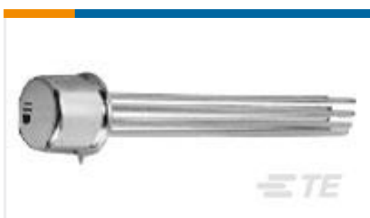
TE 产品编号1617351-8 JMACDG-12XMS=M39016/15-115M