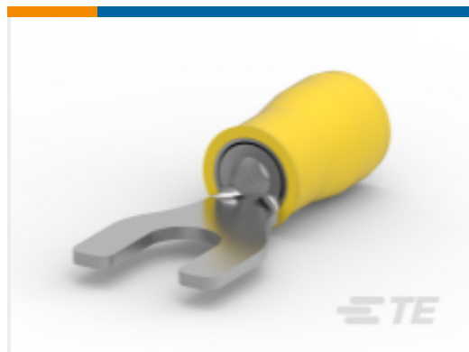
TE 产品编号 35152 TERMINAL,PIDG SPD 12-10 8