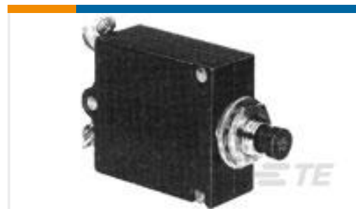
TE 产品编号2-1423678-0 W23-X1A1A-20=CKTBKR,THERM,PB, SCW,BUSH