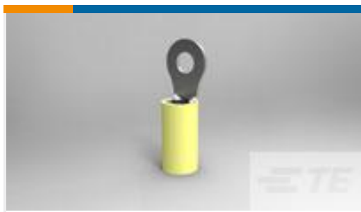
TE 产品编号 2-320568-2 TERM, RT, PIDG IR, 12, #8