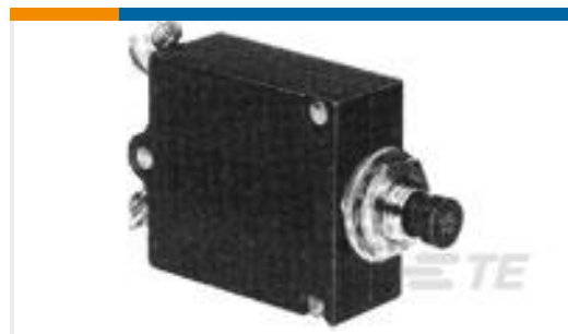
TE 产品编号 6-1393246-9 W23-X1A1G-25=W23/W31-