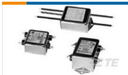
TE 产品编号6609034-1 1VDK1=F7588 SO