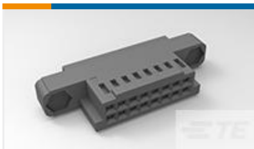
TE 产品编号2-88637-6 044 HOUSING FFC RCPT DR 100CL