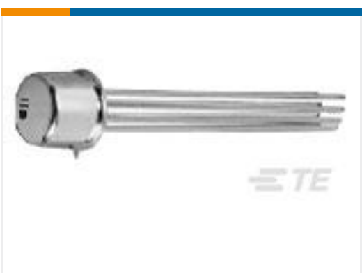
TE 产品编号1617119-5 J1MAW-18XP = M39016/7-021P