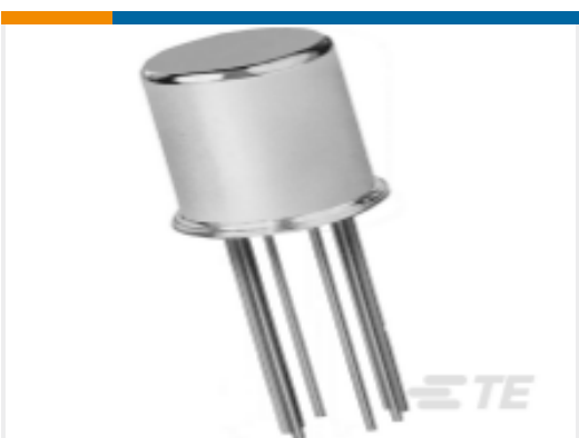
TE 产品编号1617164-7 JMACT-5XL = M28776/1-025L