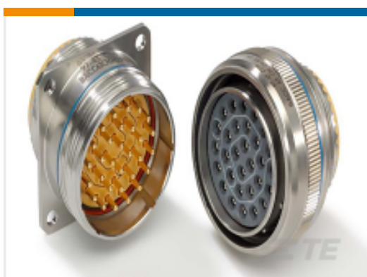
TE 产品编号ZPF0000000000007174 983-0RS 08-98 PN