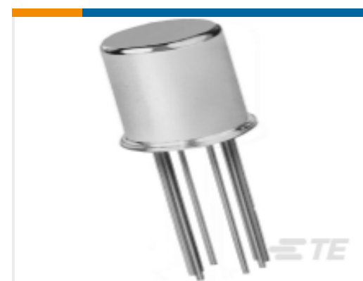
TE 产品编号1617164-7 JMACT-5XL = M28776/1-025L