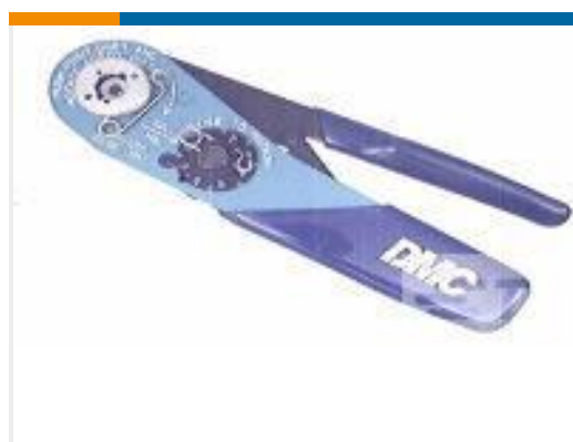
TE 产品编号 601966-1 CRIMPING TOOL M22520/2-01