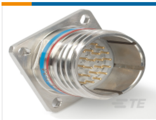
TE 产品编号YACT20MG16HNV00100 SQUARE FLANGE RECEPTACLE