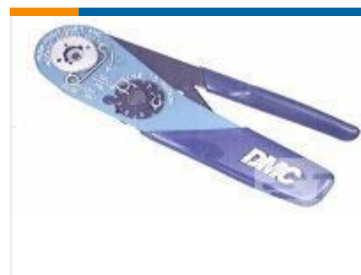
TE 产品编号 601966-1 CRIMPING TOOL M22520/2-01